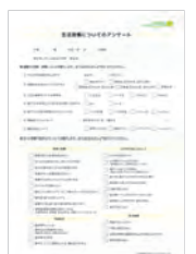
生活習慣アンケート